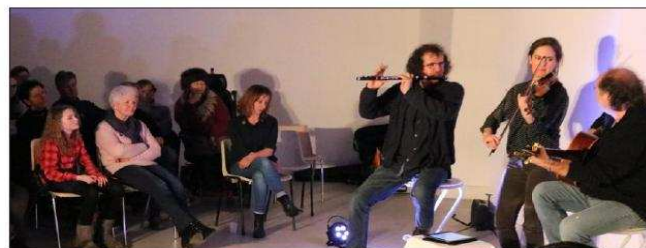
Un public fourni a pu apprécier la maestria des Irish Buskers, comme un air de pub irlandais, les pirtes de bière en moins.