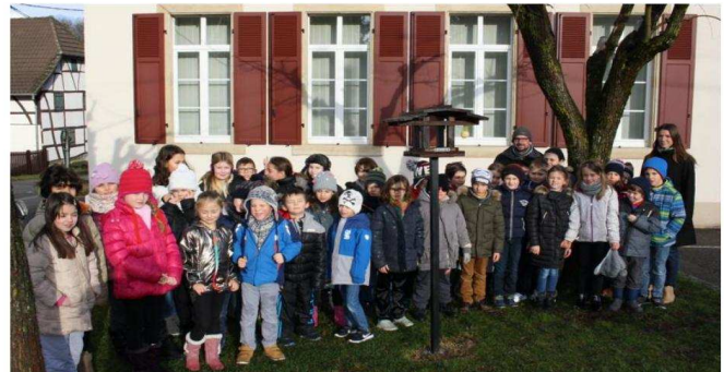
Les élèves de Fulleren.